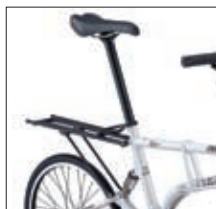
REAR CARRIER / ¥15,750