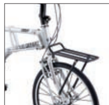
FRONT CARRIER / ¥10,500

設計を一新したMV Fの特徴は簡単にコンパクトな折りたたみを実現したこと。そのためにユニークなジョイント機構を持っています。ロッドによって固定されるフレーム部は、どこかしらクラシカルな造形にも見えてきます。同フレーム形状のMV Rと異なり、フロントギヤはシングルとなり、またタイヤサイズも一回り太いサイズに変更されています。