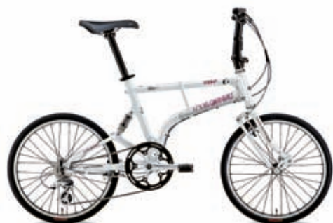
LG WHITE (PINK LOGO)(430mm)