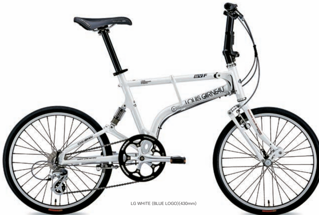
LG WHITE (BLUE LOGO)(430mm)