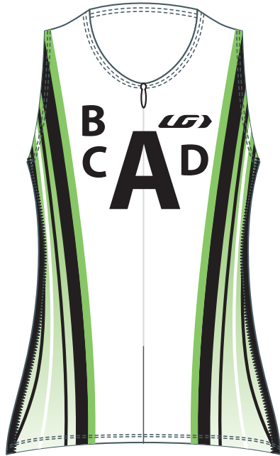
FRONT / DEVANT

TEL.: (418) 878-4135 FAX: (418) 878-4335 teamexport@louisgarneau.com