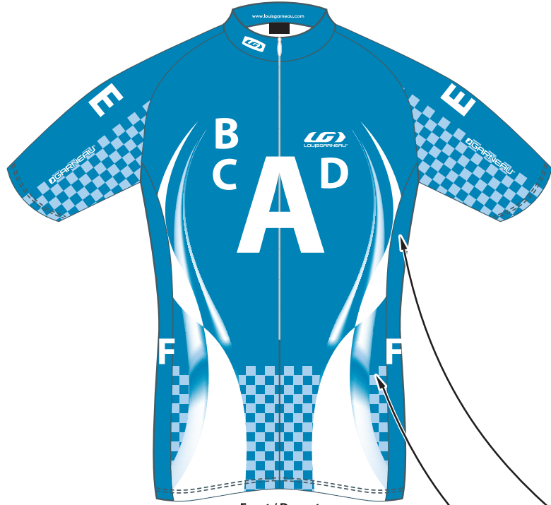
Front / Devant

TEL.: (418) 878-4135 FAX: (418) 878-4335 teamexport@louisgarneau.com