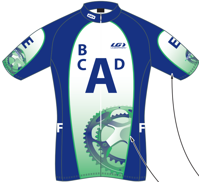
Front / Devant

TEL.: (418) 878-4135 FAX: (418) 878-4335 teamexport@louisgarneau.com