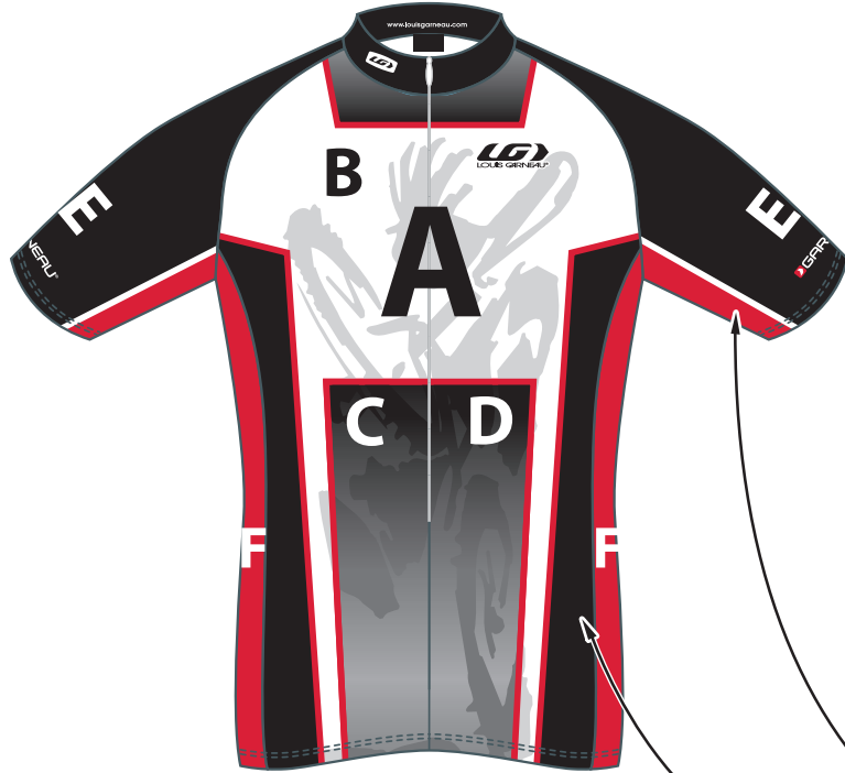
Front / Devant

TEL.: (418) 878-4135 FAX: (418) 878-4335 teamexport@louisgarneau.com