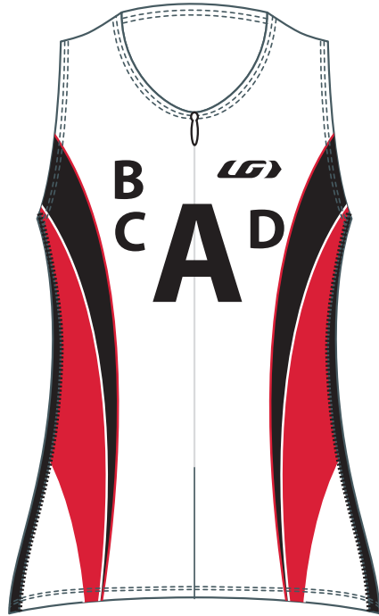
Front / Devant

TEL.: (418) 878-4135 FAX: (418) 878-4335 teamexport@louisgarneau.com